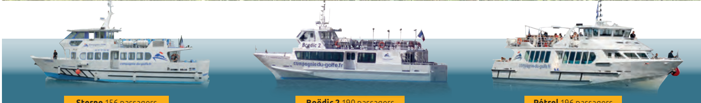
Sterne 156 passagers