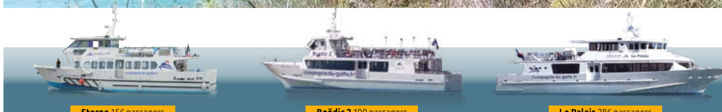
Sterne 156 passagers